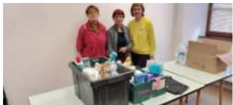
Sté Saint-Vincent de Paul