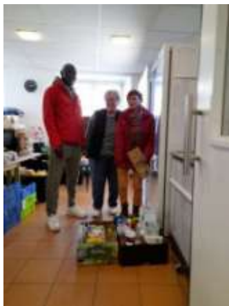
Épicerie Solidaire Caritas