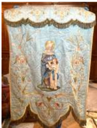
L'Education de la Vierge Marie par Sainte-Anne, bannière en brocart de soie peint et brodé

Ces instances conseillent aussi les paroisses. Par exemple à Saint Léger nous avons eu recours à un spécialiste pour nous expliquer la fonction et la symbolique des bannières anciennes retrouvées à l'occasion des travaux dans la sacristie.